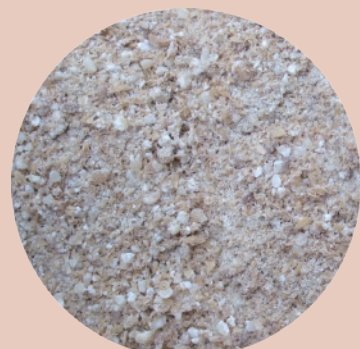
ソフトグレインサイレージ