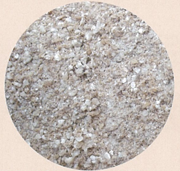
ソフトグレインサイレージ